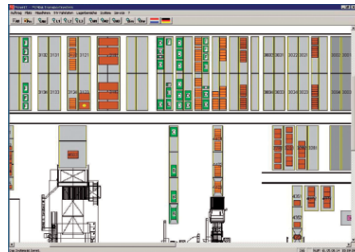
▲ Рис. 1 Отображение последовательности штабелей (зеленая маркировка)

В зоне съема с гофроагрегата система точно определяет, каким образом штабели гофрокартона (в какой после-