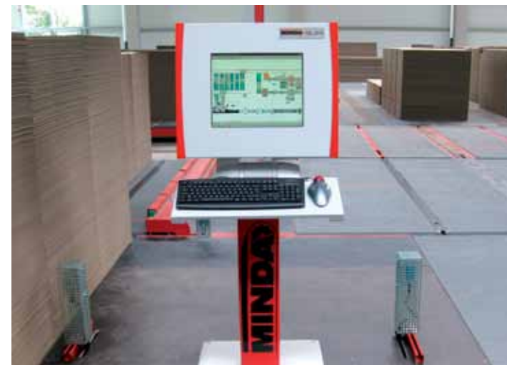
▲ Рис. 3 Пульта управления MINDA для внесения данных оператором