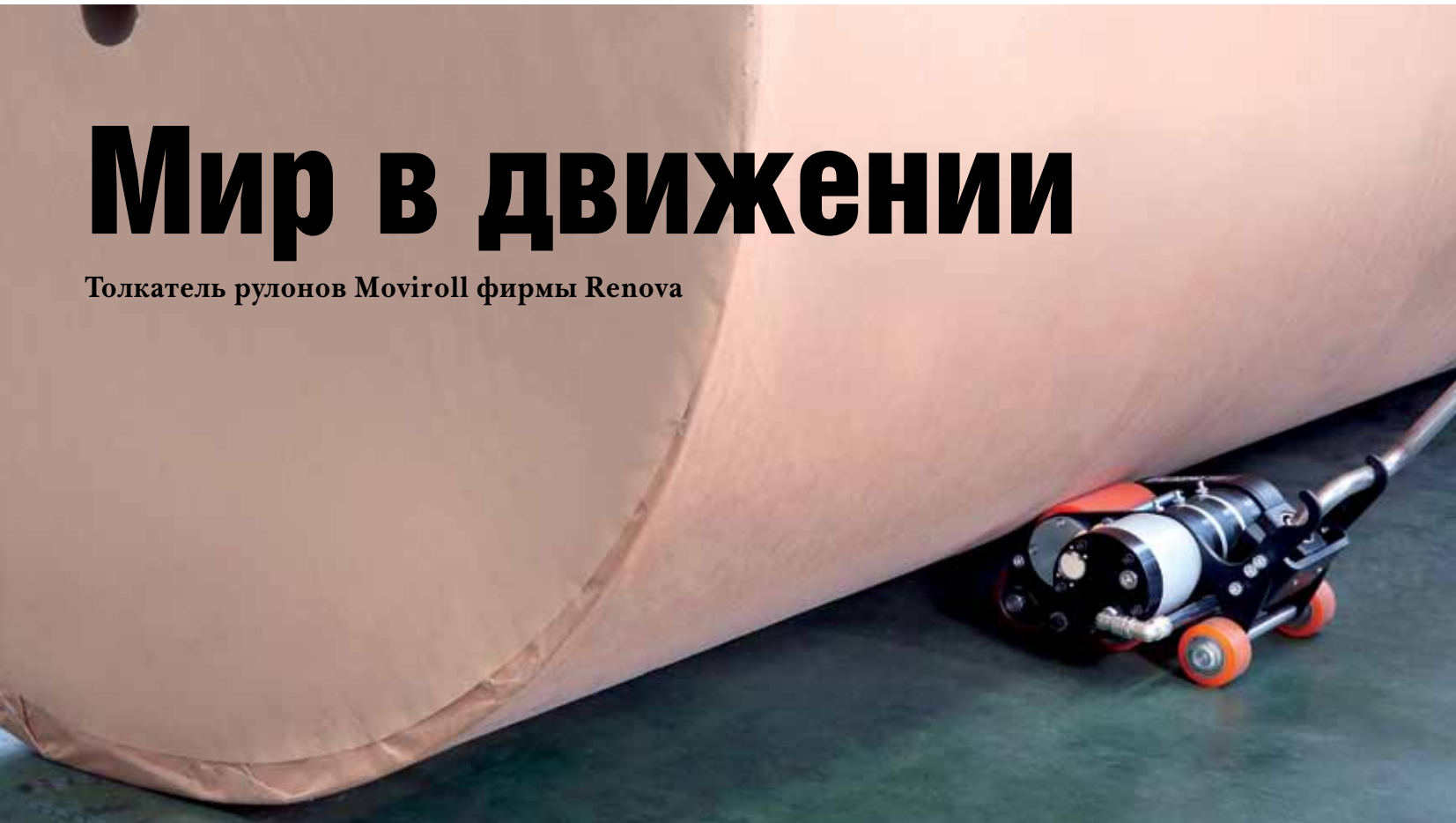
Roll pusher Moviroll from Renova

Ф ирма Renova рада представить вашему вниманию новый надежный толкатель рулонов Moviroll в двух версиях – пневматический и на аккумуляторах.