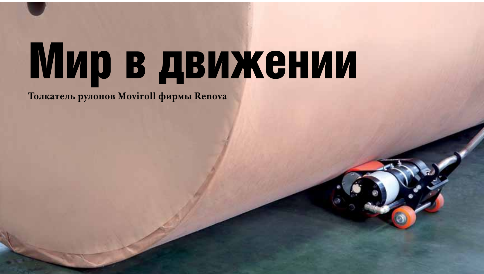
Roll pusher Moviroll from Renova

Ф ирма Renova рада представить вашему вниманию новый надежный толкатель рулонов Moviroll в двух версиях – пневматический и на аккумуляторах.